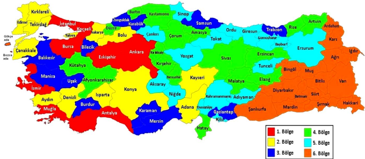
Harita 1: Yeni Bölge Sınıflamasına Göre İllerin Haritası

Teşvik unsurlarından gümrük vergisi muafiyeti, katma değer vergisi istisnası, vergi indirimi teşviki, sigorta primi işveren hissesi desteği, yatırım yeri ve faizi desteği; daha önceki teşvik mevzuatında da yer alan ve halen uygulanmaya devam eden teşviklerdir. Bununla birlikte, gelir vergisi stopajı ve sigorta primi işçi payı desteği ile KDV iadesi teşviki yeni teşvik unsurlarıdır.