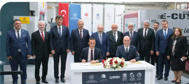
ESKİŞEHİR SANAYİ ODASI MESLEKİ EĞİTİM MERKEZİ AÇILIŞI GERÇEKLEŞTİRİLDİ