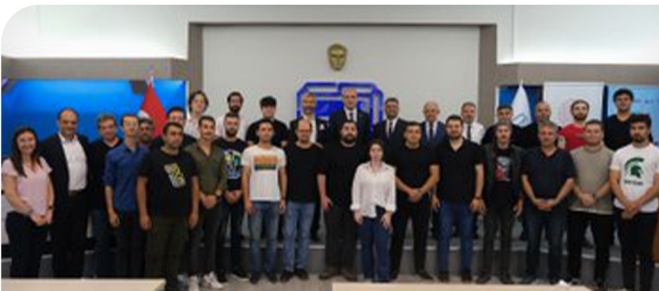
BEBKA DESTEKLERİYLE ESKİŞEHİR'DE GENÇLER İŞ SAHİBİ OLUYOR