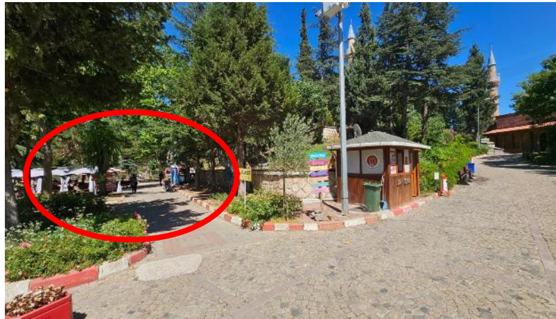
Danışma Ofisi/Karşılama Merkezi Mevcut Alan (2)