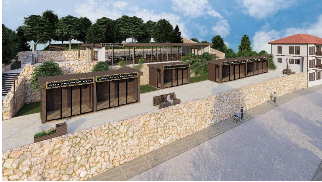
Restoran ve Satış Üniteleri Proje Sonrası Plan (3)