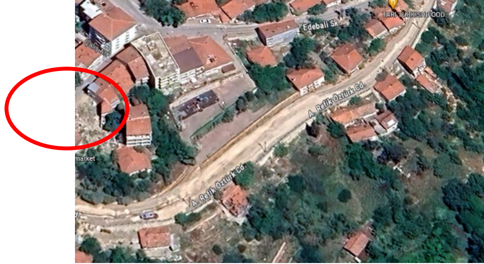
Restoran ve Satış Üniteleri Mevcut Alan (1)