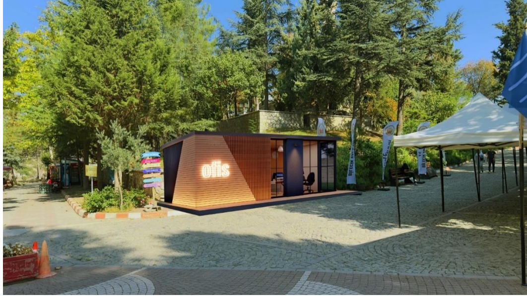
Danışma Ofisi/Karşılama Merkezi Proje Sonrası Plan (3)