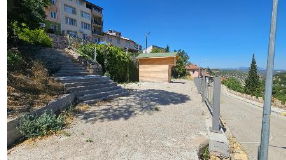
Restoran ve Satış Üniteleri Mevcut Alan (2)